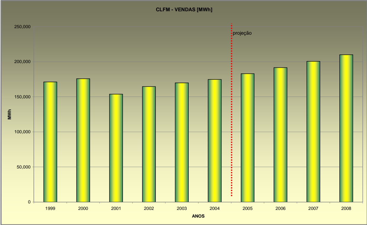
Gráfico 1 - Caso Base - Vendas [MWh]

No gráfico 1 representa-se os valores históricos e projetados de vendas físicas.