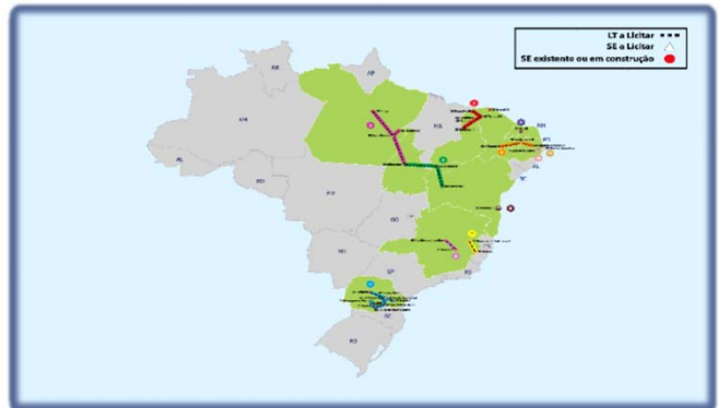
RESUMO DOS LOTES CONTRATADOS