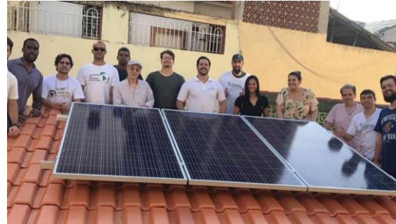
Figura 6: Voluntários do ESF-Rio no projeto de educação sustentável na AMAR de São Cristóvão

Solicitamos que a ANEEL se abstenha dos encargos sobre a energia compartilhada.