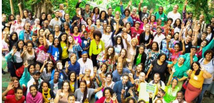
Figura 2: Encontro da Rede Favela Sustentável 2019

A Rede Favela Sustentável (RFS) é uma rede com mais de 800 participantes e centenas de projetos, em sua maioria mobilizadores de práticas sustentáveis que vivem em favelas fluminenses, além de técnicos aliados que busquem apoiar estas iniciativas.