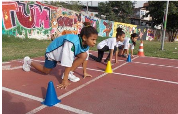
Figura 10: Programa Dois Toques com oficinas esportivas, de lazer, leitura, escrita, informática e artes

Hoje, toda a energia gerada pelo sistema solar é aproveitada para reduzir a conta de energia. Pela proposta da Aneel, somente 37% da energia gerada em horas sem atividades escolares seriam contabilizadas - uma redução que nos forçará a reduzir atividades benéficas para a sociedade.