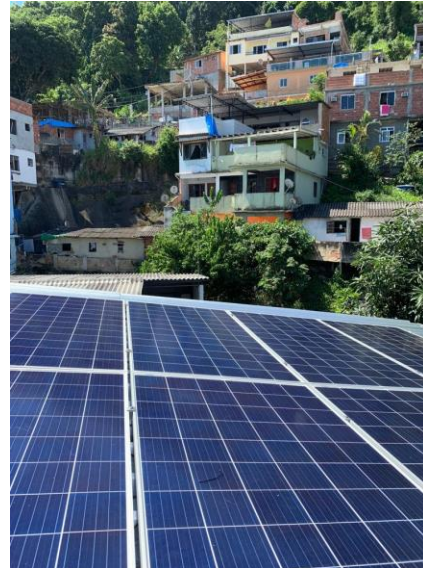
Figura 3: Sistema solar no Morro da Babilônia / Chap-eu-Mangueira

Por fim, solicitamos uma atuação firme da ANEEL frente à distribuidora local (Light) que não está atendendo essa região de forma adequada, em dissonância às diretrizes da Agência. Funcionários da distribuidora justificam os atrasos de conexão e visitas técnicas com o argumento de que as comunidades são áreas de risco, mesmo que duas Unidades de Polícia Pacificadora (UPP) garantam a segurança desde 2009, e funcionários da empresa são vistos diariamente na comunidade retirando conexões clandestinas.