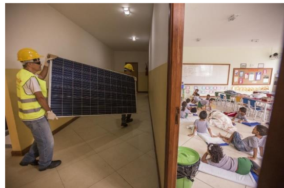
Figura 5: Embaixadores da Insolar instalaram painéis solares em todas as creches da favela Santa Marta

Oportunidades: Estes desafios não inviabilizam a adoção da tecnologia fotovoltaica como uma das principais ferramentas para que o setor elétrico possa equacionar seus maiores desafios. Muito pelo contrário, eles fortalecem ainda mais a importância de se preservar essa ferramenta, protegida de quaisquer ônus ou taxações e estimulada através de novos modelos de negócio, acesso a crédito, subsídios, isenções, e de todas as demais formas possíveis de estímulo que permitam que estas comunidades prosperem.