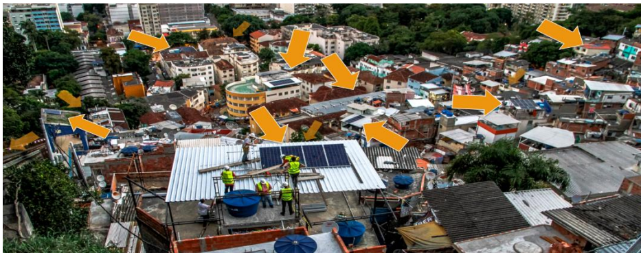
Figura 4: Locais que receberam instalações fotovoltaicas através da Insolar

Entidades: Insolar Assessoria Empresarial e Social Ltda. e Associação Instituto Insolar, em conjunto intituladas apenas "Insolar".