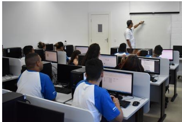
Figura 12: Projeto Juventude e Oportunidade

Ou seja, promover atividades que atendam suas necessidades formativas, educativas e sociais, ampliando seu repertório educacional e cultural, sua autonomia e preparando-os para o exercício da cidadania.