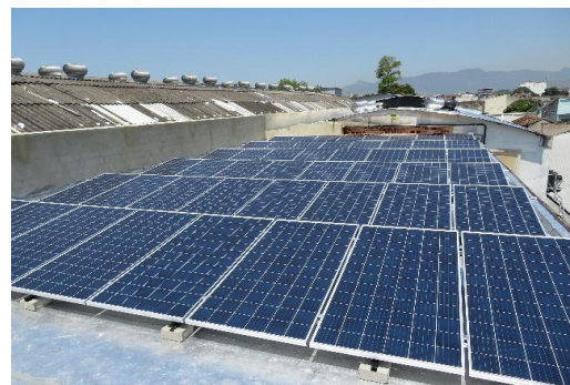
Figura 7: Sistema fotovoltaico no Bela Maré