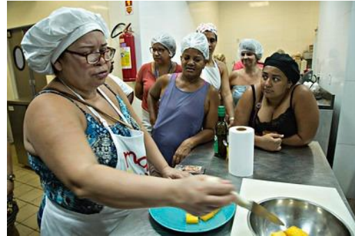
Figura 8: Projeto Maré de Sabores na Casa das Mulheres da Redes da Maré

Contamos na Maré com uma excelente incidência solar, facilitando a participação na construção de um novo diálogo energético tem fortes impactos socioambientais, econômicos e de desenvolvimento sustentável.