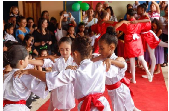
Figura 13: Balé na SER Alzira de Aleluia

SER Alzira de Aleluia é uma organização comunitária sem fins lucrativos cuja missão é trabalhar ao lado da comunidade do Vidigal, promovendo a cidadania e fornecendo profissionais educacionais, esportivas e formação cultural no Vidigal, assim como a promoção de espaços de reflexão, independência e autonomia.