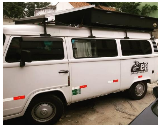
Figura 9: Kombi da ELA com sistema solar

A ELA possui um pequeno sistema fotovoltaico que produz de forma independente e gratuita, energia para os afazeres artísticos e pedagógicos da Escola (projeção, luz, ventilador, geladeira, som etc). O painel solar também gera debates